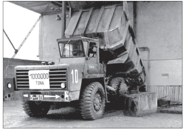
Fig. 3. Millionth ton – 1974

In the initial phase of the mine's operation, production was based on the following machines and devices: DCJ jaw crushers, MAKRUM 40.17 jaw crushers, and SYMONS 5.5 cone crushers.