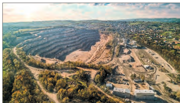
Fig. 1. “Zalas” Porphyry Mine

The “Zalas” Porphyry Mine (Fig. 1) is engaged in the extraction and mechanical processing of porphyry rocks of volcanic origin [1].