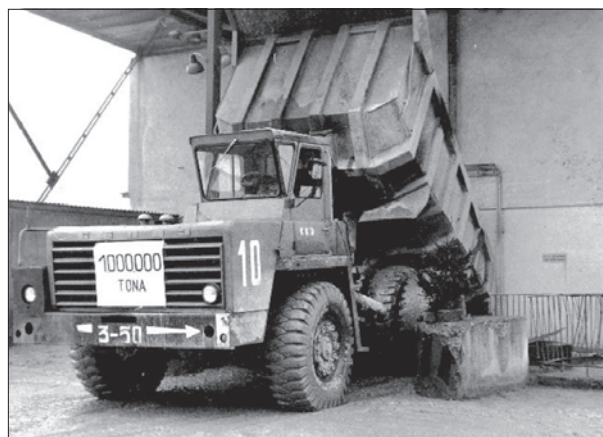
Rys. 3. Milionowa tona – rok 1974

W początkowej fazie funkcjonowania kopalni zakład prowadził produkcję z wykorzystaniem następujących maszyn i urządzeń: kruszarki szczękowe DCJ, kruszarki szczękowe MAKRUM 40.17, kruszarki stożkowe SYMONS 5.5.