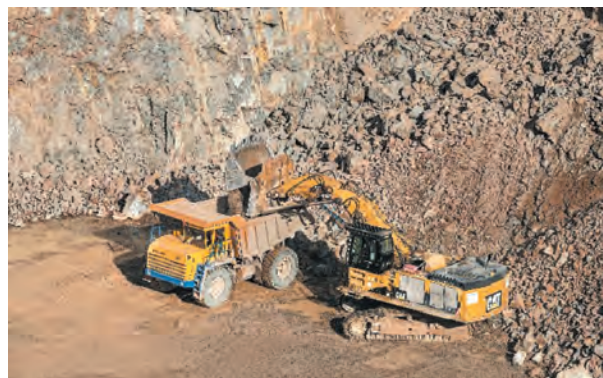
Rys. 10. Jednonaczyniowa hydrauliczna koparka przedsiębiorna CAT 385C FS

Obecnie załadunek prowadzony jest jednonaczyniowymi hydraulicznymi koparkami przedsiębiornymi Caterpillar (CAT) 385C FS (rys. 10) oraz Bola LB-600 (rys. 11).