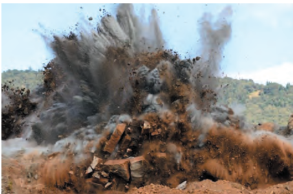
Fig. 5. Blasting works

The rock extracted in volcanic origin rock mines is hard and difficult to mine mechanically. If there are no contraindications, the only solution enabling large-scale extraction and production is drilling and blasting (blasting works) (Fig. 5).