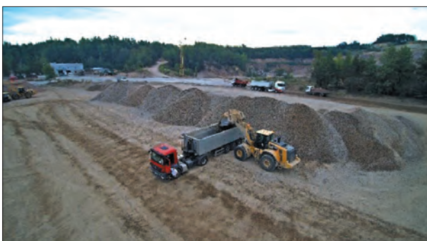
Fig. 16. Loading on a yard with a CAT 972M loader

Finished materials are loaded onto both cars (Fig. 16) and wagons (Fig. 18).