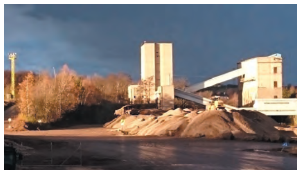
Fig. 15. Processing plant of the “Zalas” Porphyry Mine