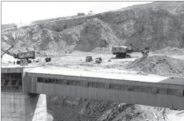
Fig. 2. Beginning of exploitation

In 1972, the finishing works of the new plant were intensified (Fig. 2). At the same time, the staff were trained and the start-up of a new processing plant began.