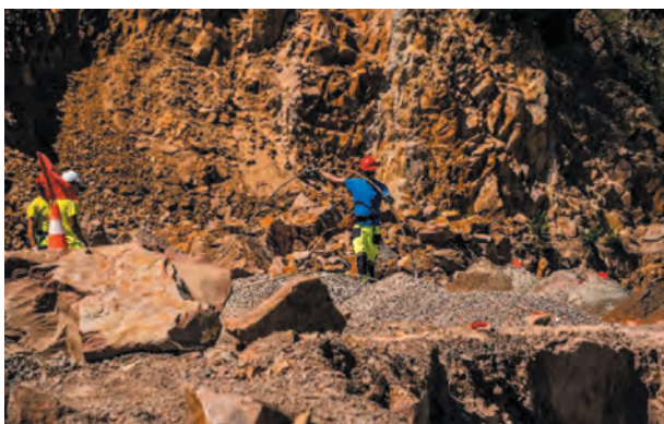
Rys. 8. Prace strzałowe wykonywane przez SSE