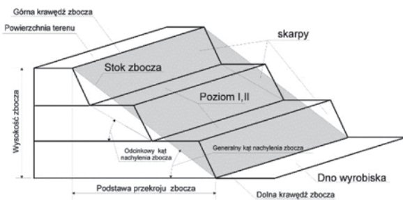
Rys. 4. Elementy budowy zbocza kopalni odkrywkowej