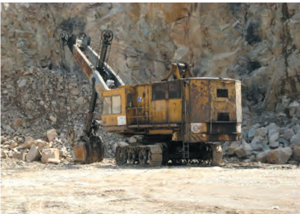
Fig. 9. Skoda E-303 single-bucket rope-electric front shovel

In the initial operation of the “Zalas” Porphyry Mine, SKODA E-303 single-bucket rope-electric front shovels were used to load mined rock (Fig. 9).