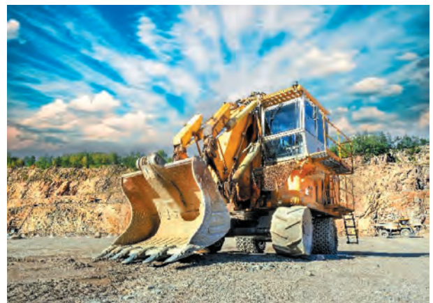
Fig. 11. Bola LB-600 single-bucket hydraulic front shovel