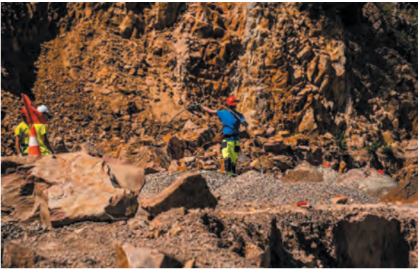
Fig. 8. Blasting works performed by SSE