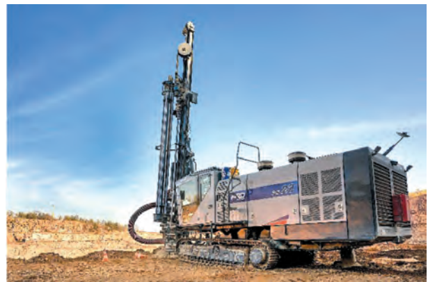
Fig. 6. Furukawa rig in the process of drilling

Blastholes are drilled with Furukawa DCR22 (Fig. 6) and HCR 1450 Japanese rigs.