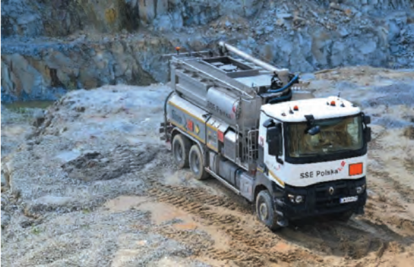
Fig. 7. Blasting rig produced by SSE

blasting works is signalled by appropriate sound signals and it is not until the signals have been transmitted that people can leave safe places – shelters.