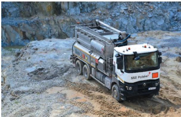
Rys. 7. Wóz strzałowy firmy SSE

strzałowych ogłaszane jest odpowiednimi sygnałami dźwiękowymi i dopiero po ich nadaniu ludzie mogą opuścić miejsca bezpieczne – schrony.