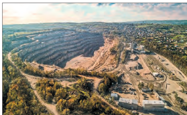
Rys. 1. Kopalnia Porfiru „Zalas”

Kopalnia „Zalas” (rys. 1) zajmuje się wydobyciem i przeróbką mechaniczną porfiru [1]. Jest to skała pochodzenia wulkanicznego, bardzo twarda i trudna w obróbce.