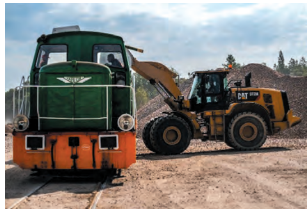
Fig. 18. Loading of railway wagons