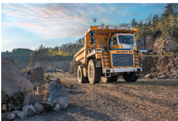
Fig. 13. Białaz 75454 rigid dump truck

Permanent technological roads are located between the exploitation levels.