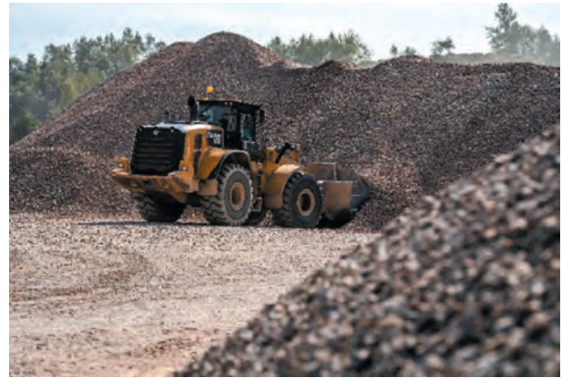
Fig. 17. Loaders during cleaning works

Apart from loading works, loaders are also used for all kinds of auxiliary works, such as: cleaning works (Fig. 17), the shaping of piles at storage yards, ongoing maintenance of permanent and temporary roads.