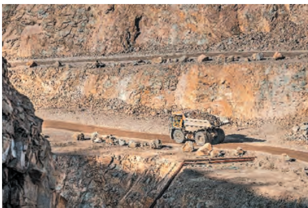
Fig. 12. Białaz 7547 rigid dump truck

Temporary technological roads are made on a stone base. The main vehicles used to transport the excavated material are Białaz rigid dump trucks (Fig. 12 i 13).