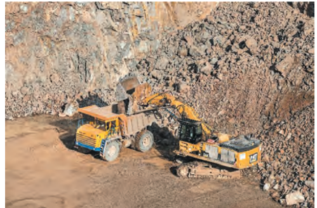
Fig. 10. CAT 385C FS single-bucket hydraulic front shovel

Currently, Caterpillar (CAT) 385C FS (Fig. 10) and Bola LB-600 (Fig. 11) single-bucket hydraulic front shovels are used for loading (Fig. 11).