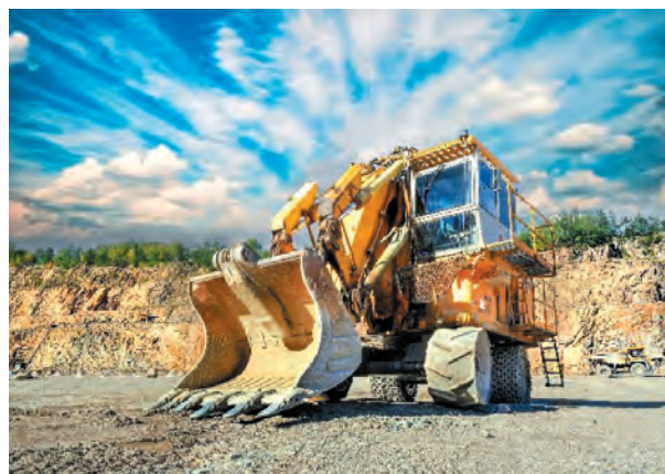
Rys. 11. Jednonaczyniowa hydrauliczna koparka przedsiębiorna Bola LB-600