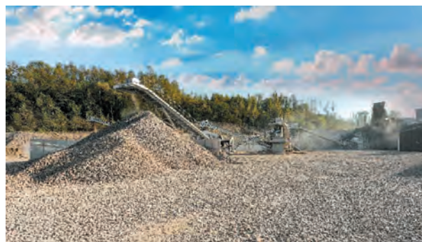
Fig. 14. Mineral aggregates production plant

First, the spoil goes to the first crushing stage (primary crushing) to DCJ jaw crushers, from where it is directed after initial separation to the second crushing stage (secondary crushing), where Metso C-110 jaw crushers and Metso HP-300 cone crushers are installed.